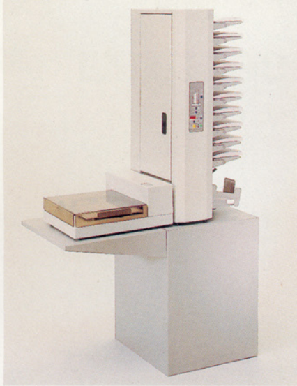
Cucitrice in Linea Gestetner 91 (opzionale)

I fogli fascicolati vengono allineati e cuciti con un punto sull'angolo superiore sinistro. I fascicoli cuciti vengono raccolti nel vassoio di raccolta del fascicolatore.